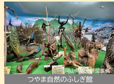
つやま自然のふしぎ館