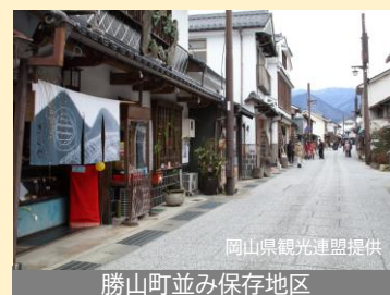
勝山町並み保存地区