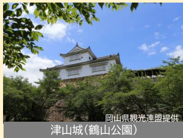
津山城(鶴山公園)