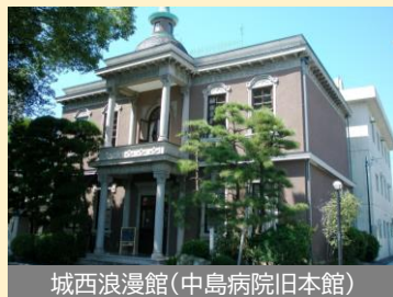
城西浪漫館(中島病院旧本館)